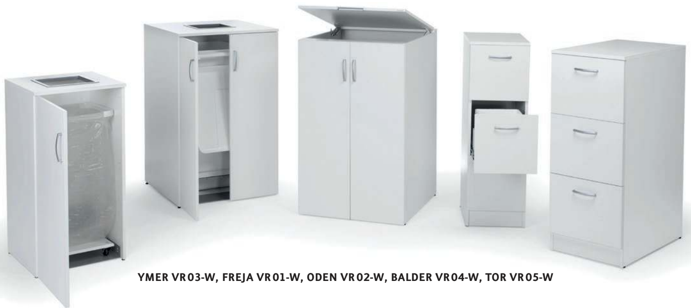
YMER VR03-W, FREJA VR01-W, ODEN VR02-W, BALDER VR04-W, TOR VR05-W

Prima Office har under 30 år utvecklat och låtit tillverka funktionella förvaringsmöbler till offentlig miljö. Med möbler för källsortering och sittmöbler breddar vi nu sortimentet. Prisvärda produkter med fokus på kvalitet, hållbarhet och stilren formgivning.